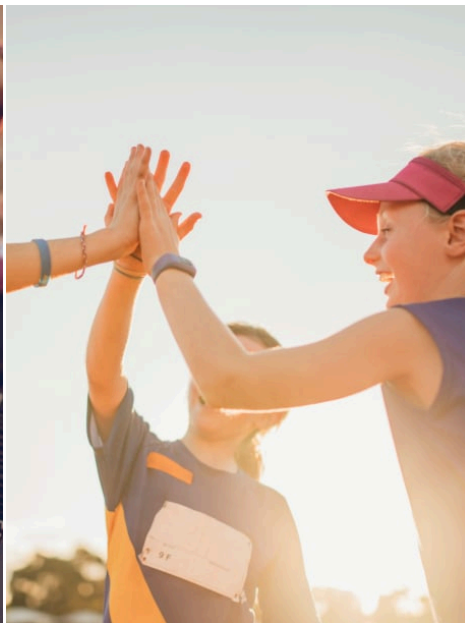
→ Warum Hobbys wichtig sind