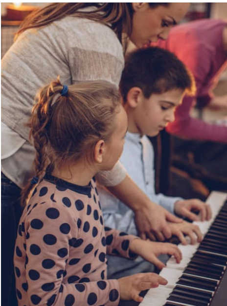
→ Hobbys für Kinder